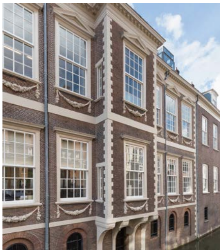
Dubbele erker uit 1648 bij Janskerkhof 13 in Utrecht. C.S. Booms 2018